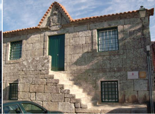
A igreja lá ou fundo e ao lado a antiga prisão agora transformada em museu.