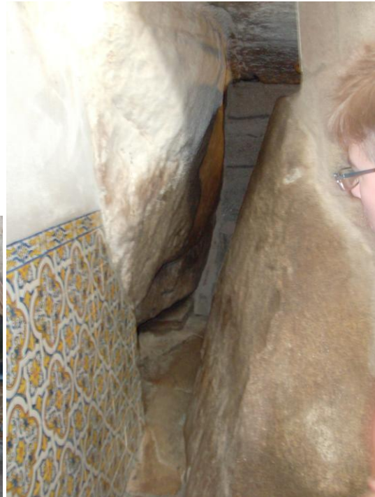
Aqui está o crocodilo e ao lado a famosa rocha onde apenas quem tem fé consegue passar!